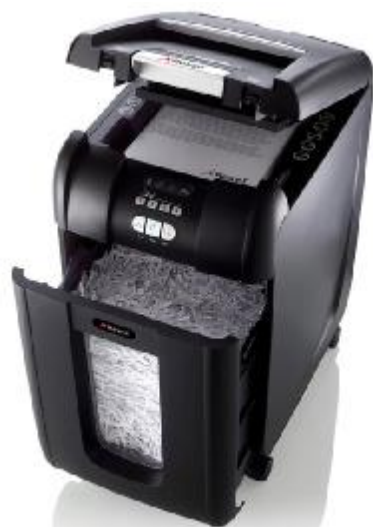
Pierwsza na świecie automatyczna niszczarka dokumentów